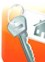
Courtienne immo Habitation