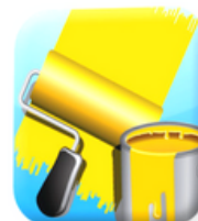
Peintre en bâtiment Construction