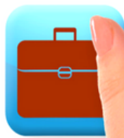
Femme d'affaires Affaires