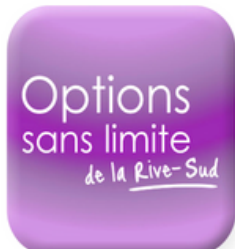
OSL Au service de l'emploi