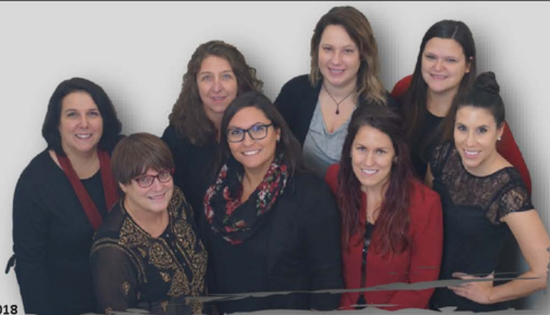
L'équipe de COFFRE Saint-Jean-sur-Richelieu 2018

42 femmes ont été rencontrées dans nos services d'emploi, volet non traditionnel. De ce nombre, 67% sont présentement en emploi ou en formation dans un secteur non traditionnel.