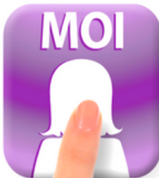
MOI Mon choix Mon projet