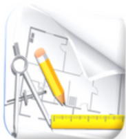
Dessinatrice en bâtiment Bâtiment